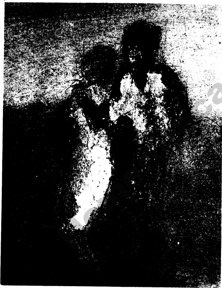
Una obra expuesta en Palma, de Vicente Calbet.