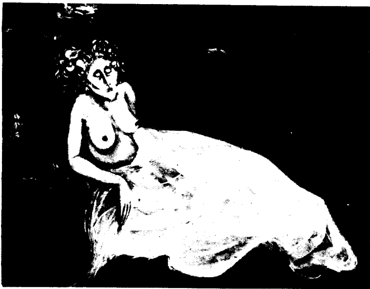
Una característica obra de Coronado.